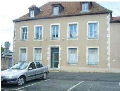
Centre de Cosne Cours sur Loire

Cosne cours sur Loire est une commune française située dans le nord du département de la Nièvre, en région Bourgogne-Franche-Comté à 200 km au sud de Paris. Avec 10000 habitants, cette sous-préfecture offre tous les services administratifs, éducation, formation, hospitaliers, ainsi qu'une offre commerciale permettant une qualité de vie calme et agréable.